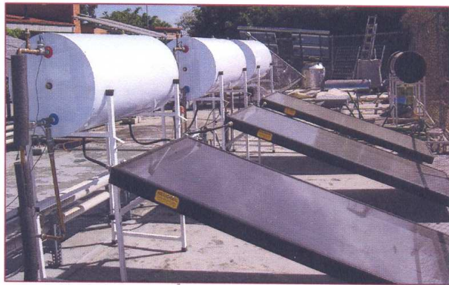
Imagen del producto ensayado en el laboratorio