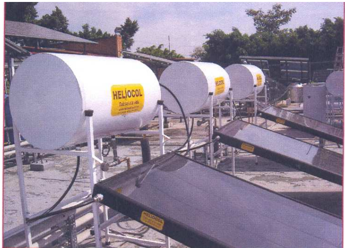
Imagen del producto ensayado en el laboratorio